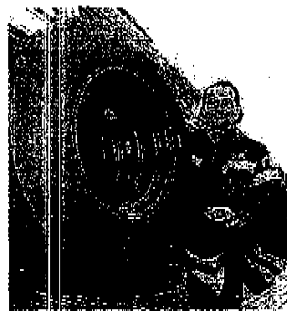
Pneumatici in dono ai pompieri

Durante l'incontro il diret- tore Gimenez ha ricordato come lo stabilimento di Spi- netta Marengo stia attraversando un periodo molto posi- tivo, con un forte aumento delle richieste di pneumatici da parte del mercato, nazio- nale e internazionale, tanto da pensare che nel 2008 la produzione aumenterà del 20% rispetto a quella di que-